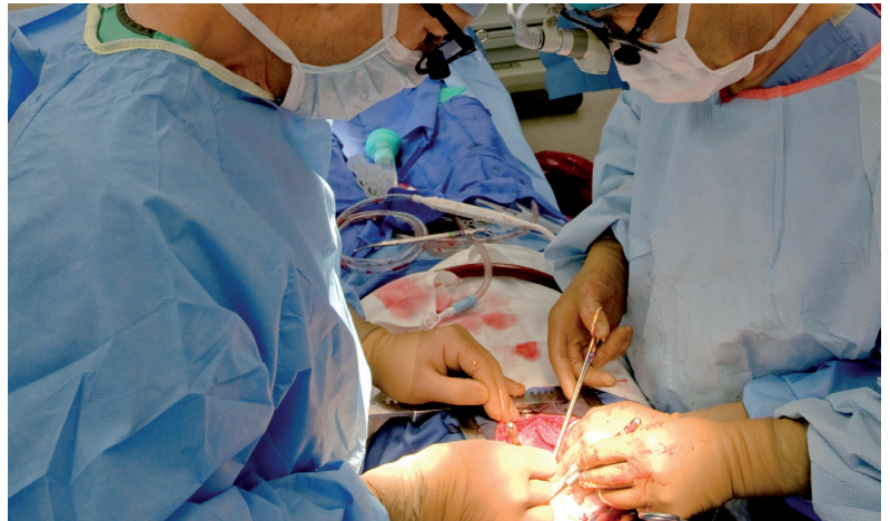
Aortocoronare Bypass-Operation: Außerhalb akuter Notfallsituation häufig vermeidbar

Operative Eingriffe an den Arterien, wie Stent oder Bypass, sind nicht nur kurzfristig hochgradig gefährlich, sondern haben auch langfristig nachweislich keinen Nutzen. Dem steht die EDTA-Chelat-Therapie als ursächliche Behandlung des arteriosklerotischen Prozesses gegenüber. Sie imponiert durch geringe Nebenwirkungen und hervorragende Langzeitergebnisse.